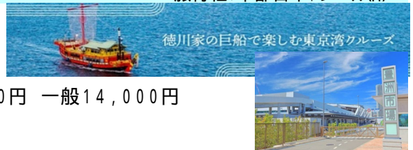
徳川家の巨船で楽しむ東京湾クルーズ